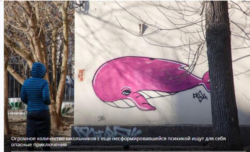
Огромное количество школьников с еще несформировавшейся психикой ищут для себя опасные приключения

Уже около года дети и подростки в России увлекаются страшным квестом - игрой в самоубийство. Все они, так называемые «синие киты», вступают в интернет-сообщества в социальных сетях и находят себе кураторов и единомышленников. Огромное количество школьников с еще несформировавшейся психикой ищут для себя опасные приключения, думают, что играют со смертью, но на самом деле покидают этот мир навсегда.